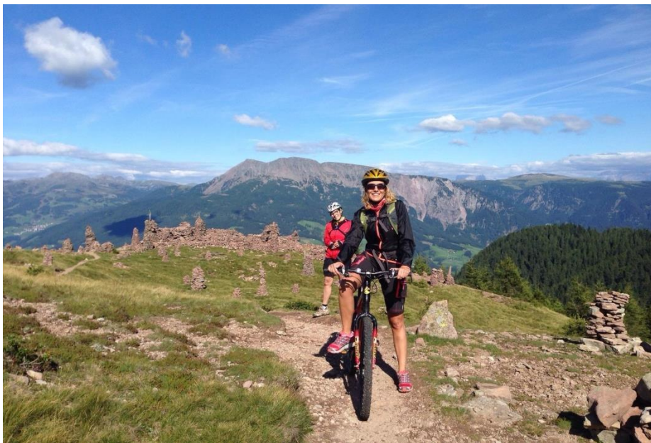
Vista del panorama in direzione sud dagli Omini di Pietra

Non solo: carta alla mano, è possibile affermare che all'interno del territorio sarentinese si trova il centro geografico assoluto del Sudtirolo. Per l'esattezza, il suddetto punto geografico è stato calcolato essere in riva a un piccolo lago (l'Urleloch, nella zona sciistica di Reinswald) che ha dato il nome anche ad un percorso didattico di recente realizzazione e finalizzato a dare ai turisti una maggiore conoscenza della flora e fauna locali.